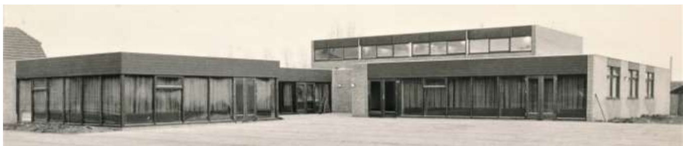
Links de grote vergaderzaal, midden de Entree, rechts het Wit Gele Kruis; hoog/achter De Sportzaal/Toneelzaal.