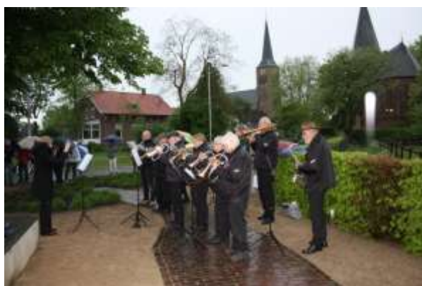
Het publiek en de muziekkapel staan in de regen bij het Luske-monument