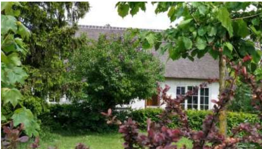
De woning in 2021 na een grondige verbouwing.

De Diergaarden is het stamhuis van de familie Arts , die later op de Aspert woonden en die gerelateerd kunnen worden aan de familie Bernts.(zie familieboek van Theo Bressers)