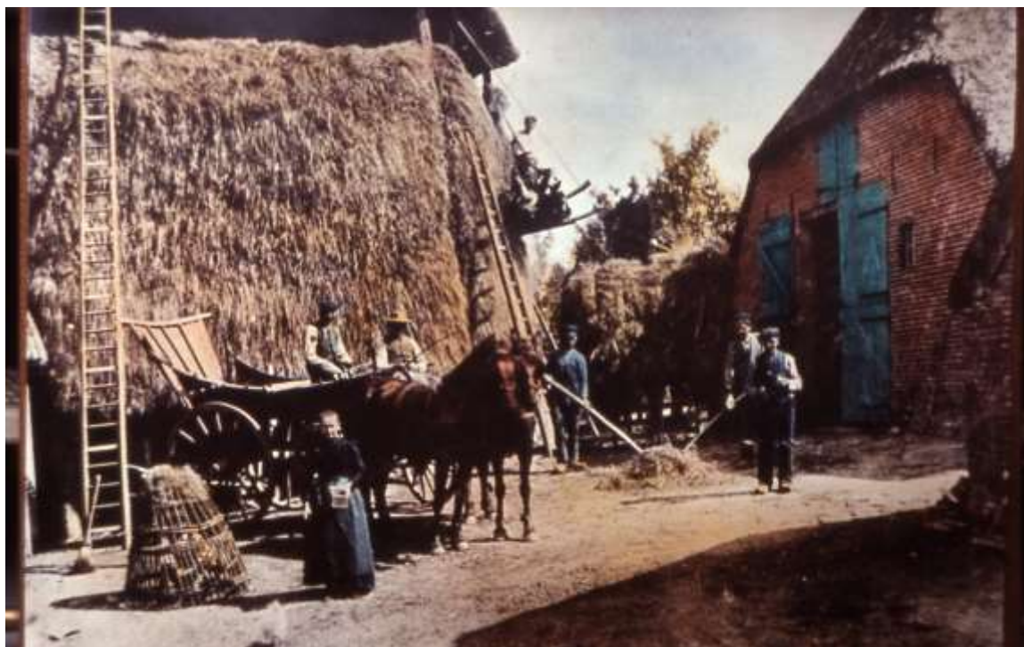
De gebroeders van de Heuvel; vooraan mogelijk Jenneke voert de kippen. De wagen werd ook gebruikt bij begrafenissen.

Sportlaan 6 “ Nooit Rust ”; kadaster 1832 A378 Petronella van den Hoogen