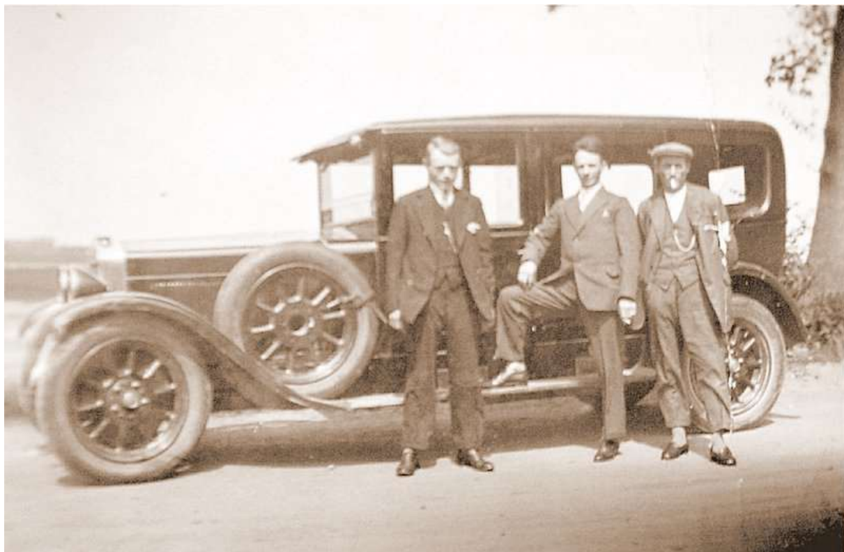
De bus van een snordersbedrijfje dat zich 'Maas- en Waalkant' noemde. Zou het de bus van Hanna van Koolwijk met Makkie zijn?