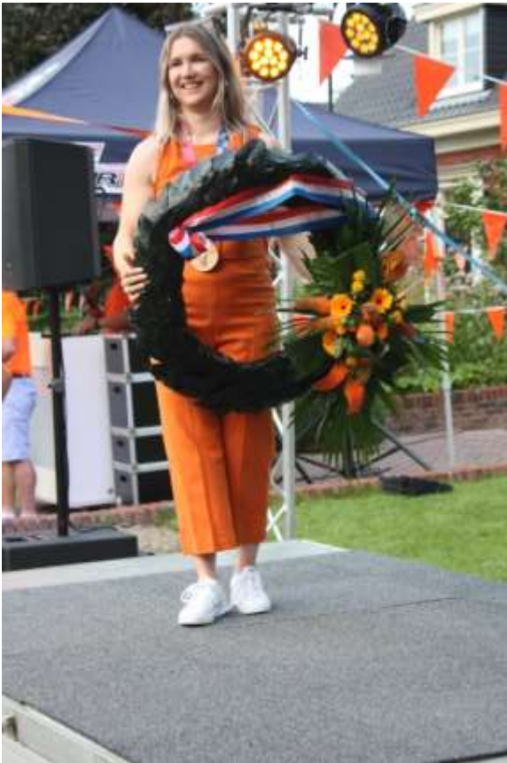
Zus Merel veroverde de bronzen medaille BMX in 2021 op de OS in Tokio.